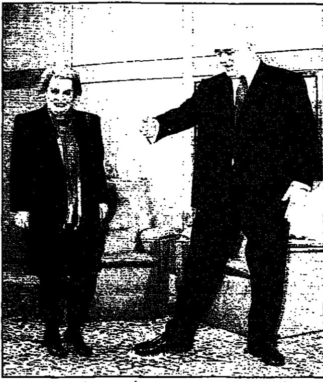
المستشار الألماني ميكلزير مع مستعمل وزارة الخارجية الأمريكية مايك أوبرايت في برلين (رويترز)

■ بون-سوفيا-اف بي-كابل مستخدم باسم وزارة الخارجية الأمريكية ان وزيرة مايك أوبرايت لا تتوقع ان تخضع تركيا على خطط ضم دول من شرق أوروبا الى حلف شمال الأطلسي على الرغم من الخلاف بين أنقرة وبيوتن.